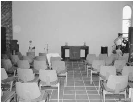
Der neue Altar aus alten Balken der Kirche

Ende der 70er Jahre des 19. Jahrhunderts verfolgte Superintendent Fengler als Pastor der Gemeinde Döbbrick den Gedanken, dass die Gemeinde in der Stadt Cottbus direkt ansässig sein sollte und nicht nur in einem der Dörfer vor der Stadt. Er betrieb den Bau einer großen Kirche in der Karlstraße, damals Stadtrand von Cottbus. 1879 konnte die neue Kirche in Gebrauch genommen werden. Der Hauptteil der Gemeinde Döbbrick hielt sich fortan nach Cottbus. Auch der Pfarrsitz wurde in das neu erbaute Gemeindehaus neben der Kreuzkirche in Cottbus verlegt. Der kleinere Teil der Gemeinde – überwiegend mit Wohnsitz in Döbbrick und einigen Nachbardörfern – verblieb als Gemeinde in Döbbrick.