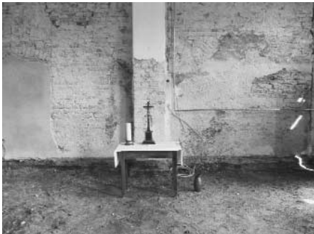
Der „Notaltar“ während der Renovierung des Innenraumes der Kirche

Aus Anlass der Weihe der sanierten Kirche in Döbbrick am 25. August 2002 hat Holger Thomas eine Informationsschrift verfasst, aus der der nachstehende Text etwas gekürzt übernommen worden ist.