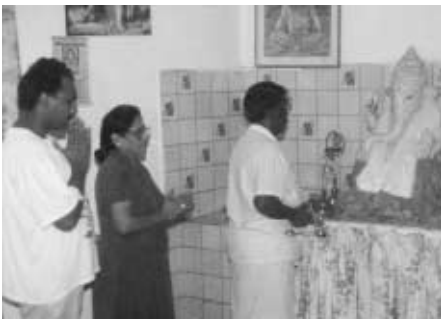
Ein Altar des elefantenköpfigen Gottes Ganesha

Wie kann ich dennoch mit diesen Menschen reden, so dass deutlich wird, dass sie von allen Ängsten befreit auf dem schwierigen Weg gehen können weg von den vielen