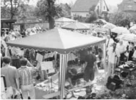
Einige Hundert waren gekommen.

der Woche für unterschiedliche Zwecke genutzt werden kann. Über dem Gottesdienstraum sind einige Räume entstanden, die für unterschiedliche Aktivitäten verwendet werden können. Alles soll dazu dienen, dass Menschen aus dem Umfeld einander und dem Evangelium von Christus in der Missionskirche in Döbbrick begegnen kön-