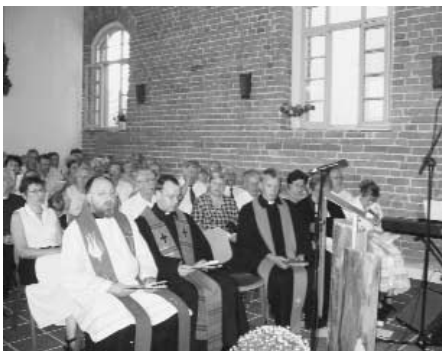
Festgemeinde am Tag der Einweihung.