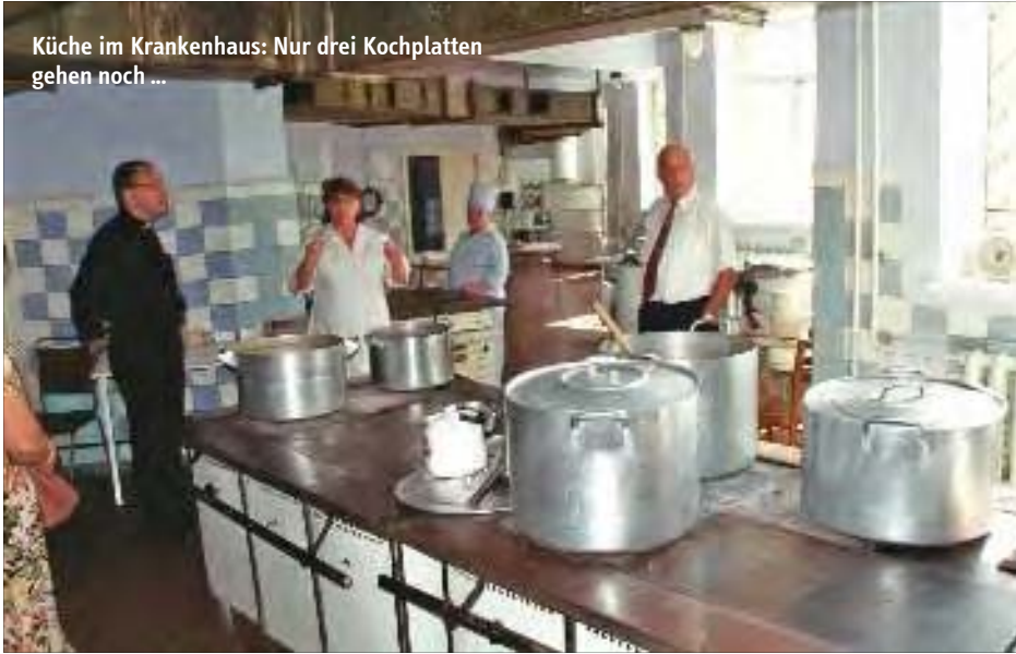
Küche im Krankenhaus: Nur drei Kochplatten gehen noch ...

Wenn der gemeinnützige Verein genügend Spenden erhält, sollen bald neue Hilfslieferungen nach Moldawien gebracht werden. Gebraucht werden Sachspenden, gut erhaltende, saubere Kleidung, aber auch Spenden für die Transportkosten oder für die oben genannten Hilfsprojekte. Der unter dem Dach der LKM entstandene Verein gehört heute zum Diakonischen Werk der Selbständigen Ev.-Luth. Kirche (SELK). Zurzeit engagiert sich der Verein vor allem in Weißrussland und in Moldawien. (Mehr über die Arbeit des Vereins unter www.humanitaerehilfe-osteuropa.de .)