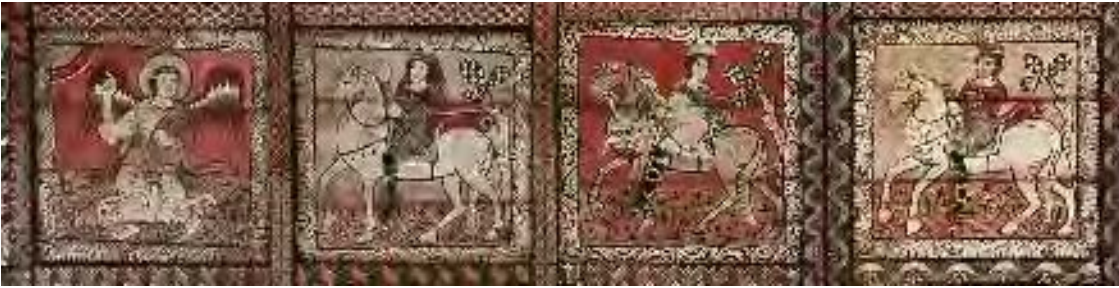
Ein Engel zeigt den Weisen den Weg. Tafeln aus der Kirchendecke in Zillis (Schweiz), 12. Jh.

liegt, kann diese Koordinaten im Internet eingeben: 46° 38' 3" N, 9° 26' 30" O)