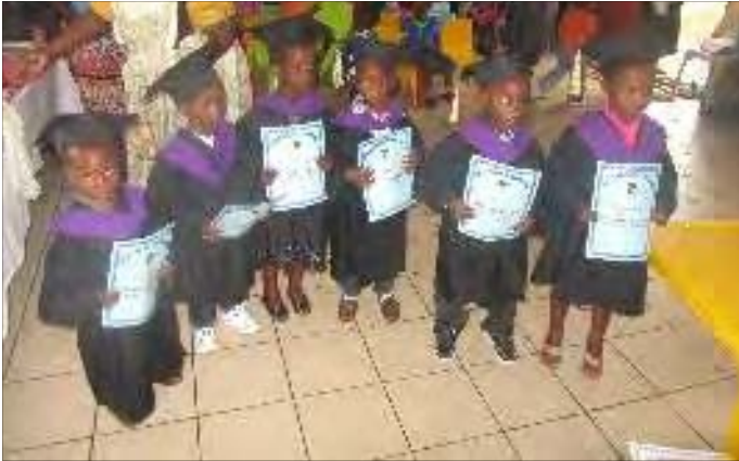
Unsicher blickend, aber ganz bestimmt sehr stolz: Die Kinder mit ihren Abschluss-Zertifikaten

und hervorhoben, wie wichtig ein guter Kindergarten in der Wohngegend der Kinder sei.