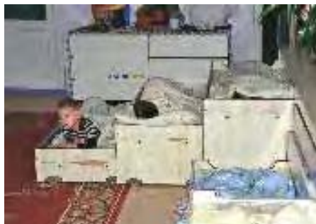
Kinder im Kindergarten in Balti beim Mittagschlaf in behelfsmäßigen Betten

Der Bürgermeister der 150.000 Einwohner Stadt Balti im Norden Moldawiens bedankte sich für die geleistete Hilfe und machte deutlich, wie sehr die Stadt im Bereich des Sozialamtes auf Hilfe angewiesen sei. Er zeigte den Besuchern Kindergärten für